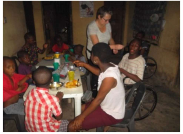
De vaste bewoners aan het ontbijt.

Een aantal dove en lichamelijk gehandicapten kinderen krijgt les, maar de meesten van hen kunnen dit vanwege hun verstandelijke beperking niet aan. In de loop van de ochtend gingen wij dan met ze zingen, kleuren of andere spelletjes doen.