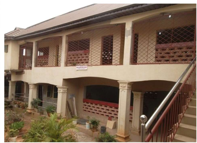
Leslokalen en de keuken.