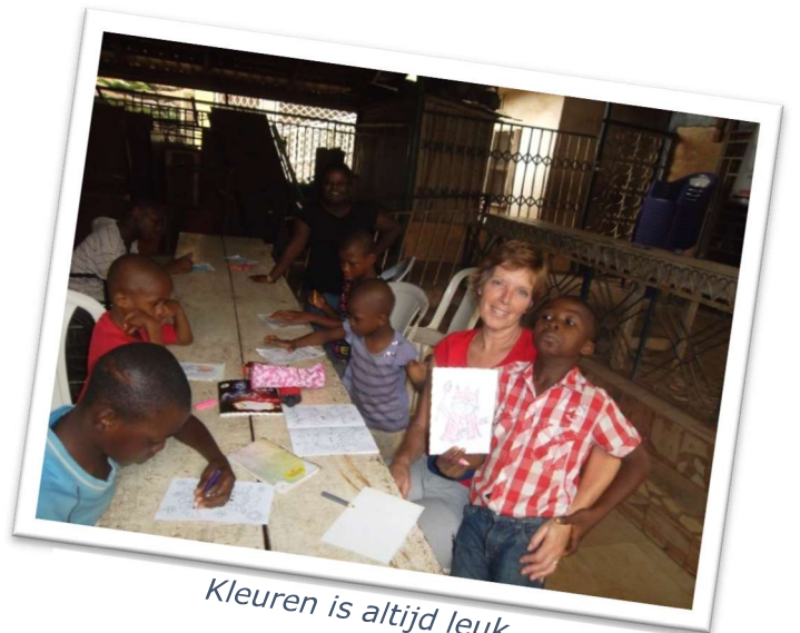
Kleuren is altijd leuk.

Zaterdag 17 maart 15.00 uur donateursmiddag in de Oude Kerk te Rijswijk