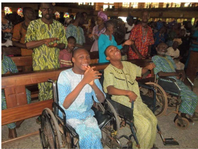
Miracle en Abraham in de kerk.