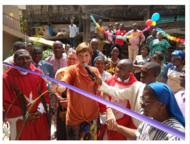
De officiële opening van de keuken.