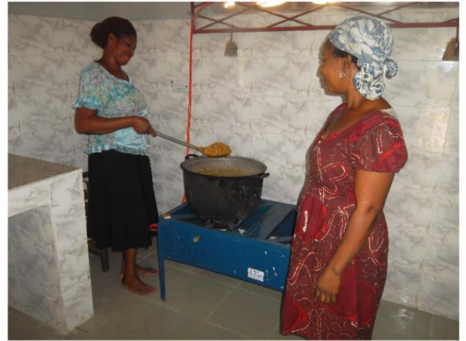
Deze dames bereiden de maaltijden.