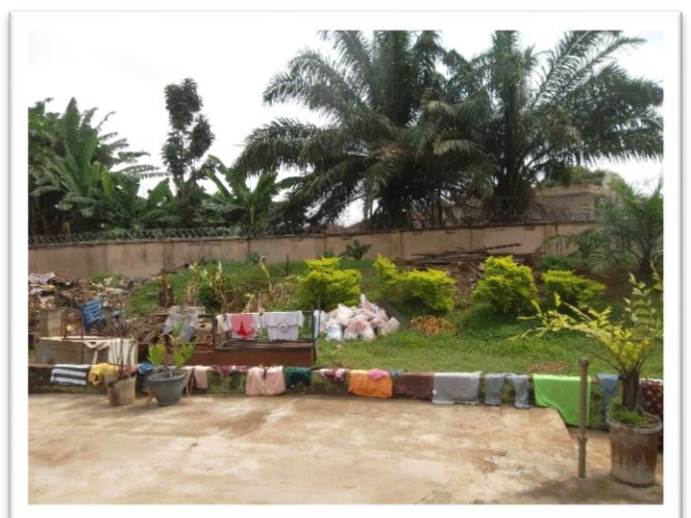
Muur met prikkeldraad tegen ongewenste indringers.

Uw gift is aftrekbaar van de inkomstenbelasting!