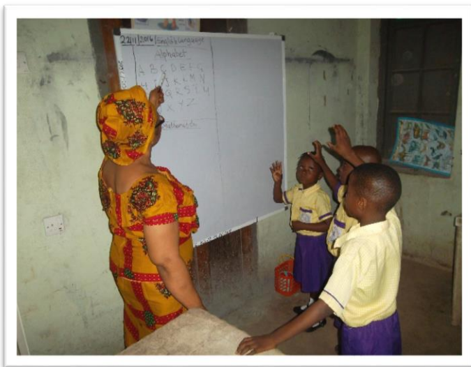
Dove kinderen leren gebarentaal.