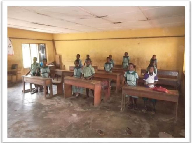
Klaslokaal in Ossiomo.