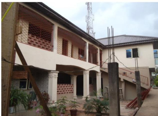
Nieuwbouw met keuken en leslokalen.