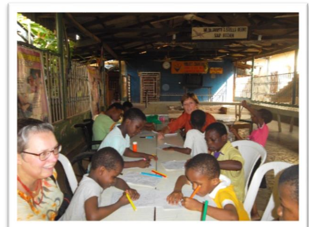
Tijd om lekker te kleuren.

Zeker moeilijke omstandigheden voor de ongeveer 12 kinderen die permanent bij Charilove verblijven omdat ze helemaal geen familie meer hebben. Vaak zijn ze bij Charilove gedumpt, omdat kinderen met beperkingen in Nigeria nog niet geaccepteerd worden. Stuk voor stuk kinderen met hun eigen, vaak schrijnende geschiedenis. Blij met een ballon, stukje stoepkrijt, een kleurtje, aandacht. Maar ook met elkaar vechtend om dat wat ze kregen voor zichzelf te behouden. Hoe begrijpelijk.