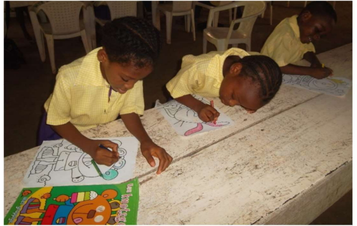
Kleurplaten doen het altijd goed.