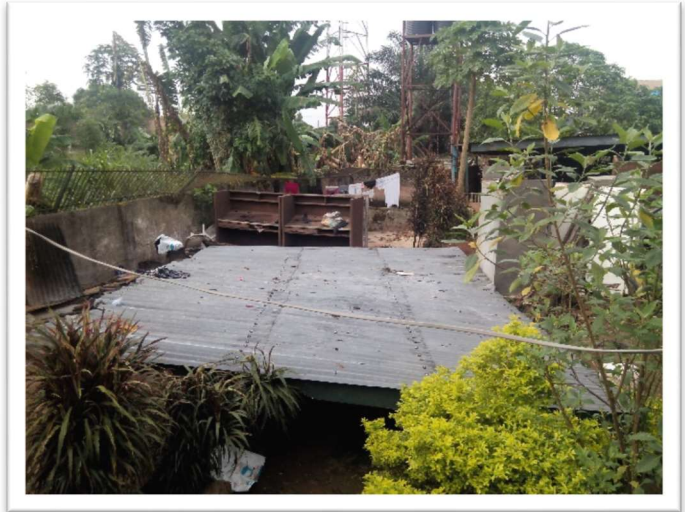
Het dak van de noodkeuken is ingestort.

Uw gift is aftrekbaar van de inkomstenbelasting!