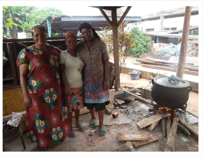
Deze dames bereiden de maaltijden.

In onze tijd komen we weinig mensen tegen die zó door de Bijbelverhalen zijn geïnspireerd en aan het werk zijn gegaan. Niet iedereen zal hier voeling mee hebben, ook niet binnen Charilove NL. En gelukkig hoeft dat ook niet. De kinderen in Benin City zullen zich ook niet gelijk afvragen uit welke gedrevenheid zij uit de goot werden opgeraapt. Ik denk aan een oude Oosterse wijsheid: wie aan een kind een vis geeft, stilt even zijn trek; wie het leert vissen, zorgt ervoor dat het nooit meer honger hoeft te hebben. En dat is nu precies wat er bij Charilove gebeurt!