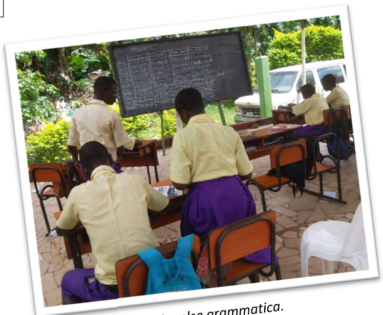
Les in Engelse grammatica.

De diaconale viering in de Benedictus- en Bernadettekerk, eveneens in Rijswijk, heeft naast een prachtige collecte allerlei nieuwe contacten opgeleverd, zoals een werving binnen het eigen netwerk van een enthousiaste bezoeker, die ruim € 2200 opleverde. Een andere bezoeker vierde haar 90 e verjaardag en bestemde haar cadeaus voor Charilove. En zij is niet de enige geweest! Zelf zijn we ook de boer op geweest, bijvoorbeeld op de vrijmarkt in Leeuwardal. Want als je je niet laat zien, weten de mensen ook niet wie je bent.