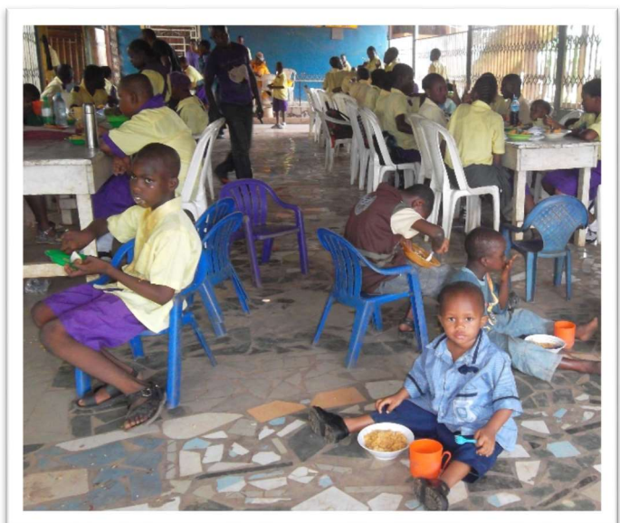
Elke dag is er een maaltijd voor de kinderen.