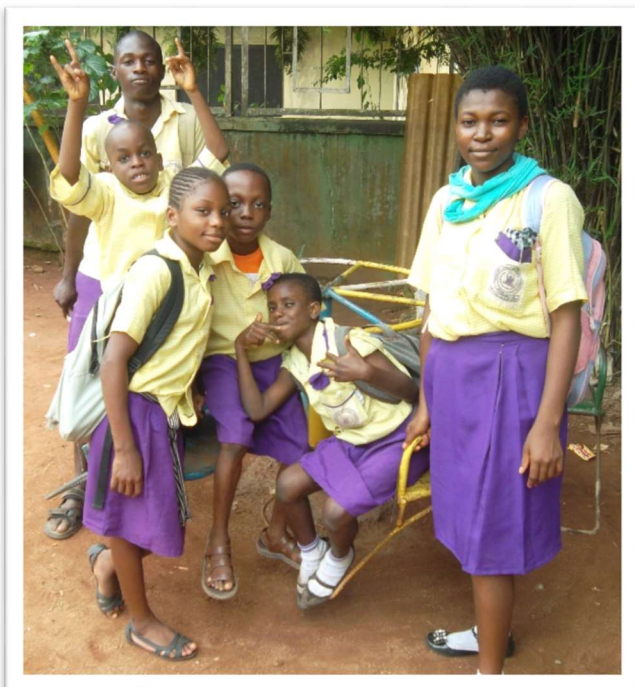
Even pauze voor de dove kinderen.