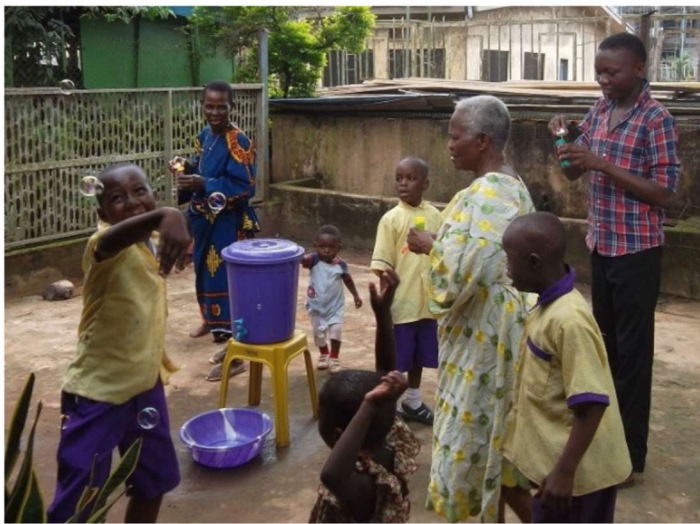
Plezier met bellenblazen.