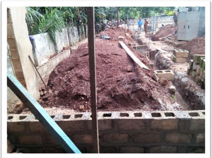
Het begin van de nieuwe keuken is er!