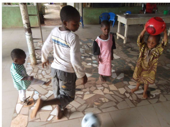
Een beetje voetballen.